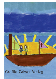
Grafik: Calwer Verlag